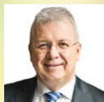
Markus Ferber Europäisches Parlament

Exklusives Dinnergespräch am Vorabend mit: