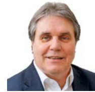
Herbert Fromme Süddeutsche Zeitung