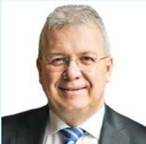
Markus Ferber Wirtschaftspolitischer Sprecher der christdemo- kratischen EVP-Fraktion · Europäisches Parlament